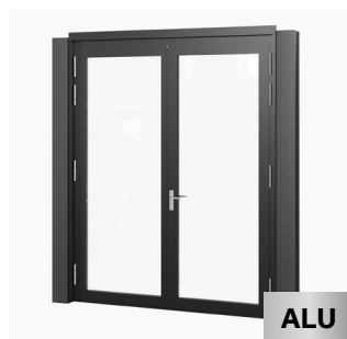
Verglasung mit Doppelflügeltür 207 x 262 cm Kauf