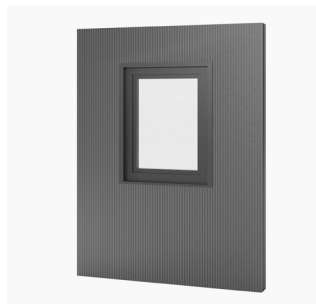
Fensterpaneel 1-flügelig, 95 x 120 cm Kauf/Miete