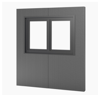
Doppelfensterpaneel 2-flügelig, 175 x 120 cm Kauf/Miete