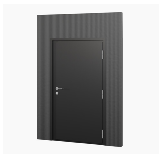
Türpaneel 115 x 210 cm Kauf/Miete