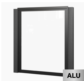
Vollverglasung 207 x 262 cm Kauf/Miete