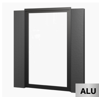
Vollverglasung (170 cm) 170 x 262 cm Kauf